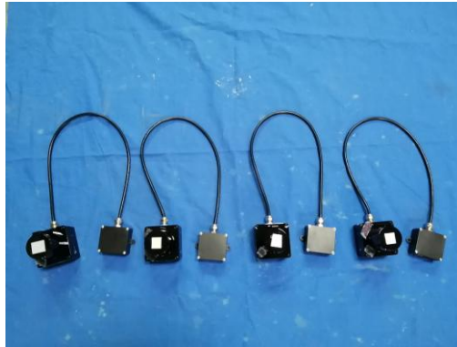
样品 WZH031803010-1 ~ 4